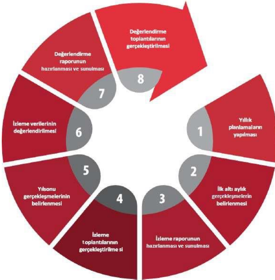
Şekil: İzleme ve Değerlendirme Süreci

İzleme ve değerlendirme sürecinin işleyişi ana hatları ile aşağıdaki şekilde özetlenmiştir: 2024–2028 Stratejik Planı'nda yer alan performans göstergelerinin gerçekleşme durumlarının tespiti yılda iki kez yapılacaktır . Ara izleme olarak nitelendirilebilecek yılın ilk altı aylık dönemini kapsayan birinci izleme kapsamında tüm amaç sorumluları, sorumlu oldukları göstergelerle ilgili gerçekleşme durumlarına ilişkin veriler “Stratejik Plan Sorumlu Müdür Yardımcısı” tarafından toplanarak performans hedeflerinin gerçekleşme durumları hakkında hazırlanan “Stratejik Plan İzleme Değerlendirme Raporu” okul müdürüne sunularak paydaşlarla paylaşılacaktır. Bu aşamada amaç; varsa öncelikle yıllık hedefler olmak üzere, hedeflere ulaşılmasının önündeki engelleri ve riskleri belirlemek ve yıllık hedeflere ulaşılmasını sağlamak üzere gerekli görülebilecek tedbirlerin alınmasıdır.